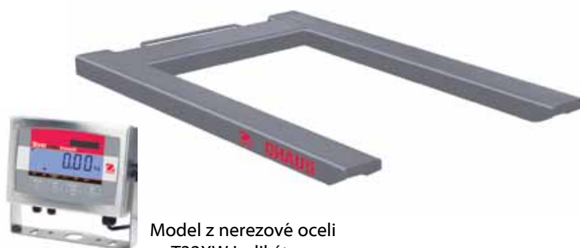
Model z nerezové oceli s T32XW indikátorem