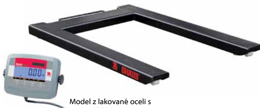
Model z lakované oceli s T31P indikátorem