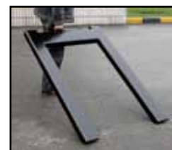
Příchytka a rolovací kolečka pro snadné přemístění